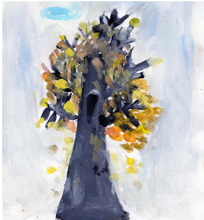
Piešė Augustas Bankauskas 1 klasė