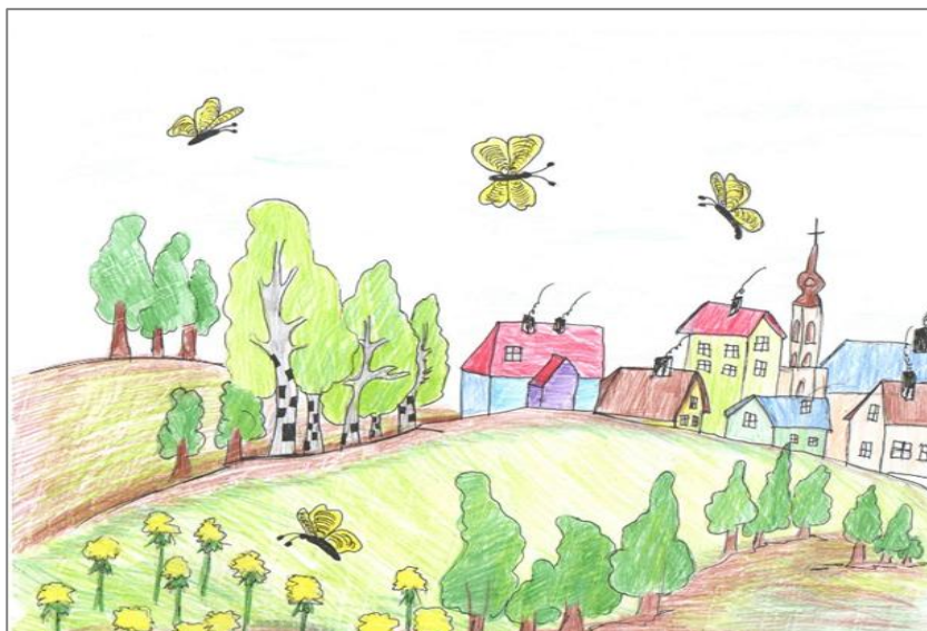
Piešė Iveta Kačinauskaitė 3 klasė