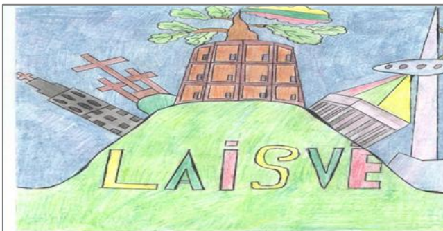
Piešė Mindaugas Rimkus 4a klasė