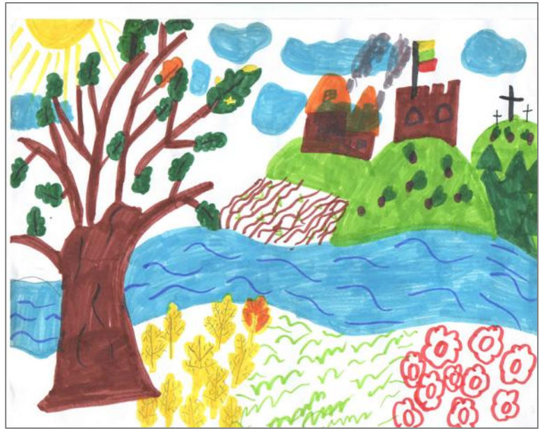
Piešė Aistė Rubavičiūtė 2a klasė