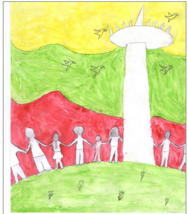
Piešė Gintarė Gerybaitė 2a klasė