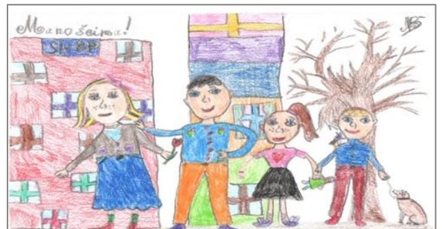
Piešė Meda Bankauskaitė 3 klasė