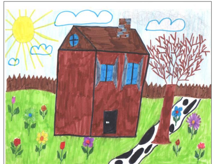
Piešė Gabija Ežerskytė 4a klasė